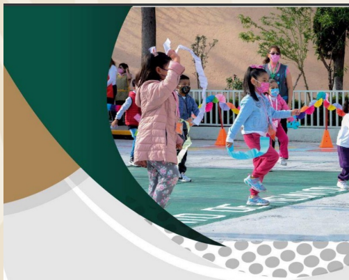
GUÍA OPERATIVA para la ORGANIZACIÓN Y FUNCIONAMIENTO de los Servicios de Educación Básica, Especial y para Adultos de Escuelas Públicas en la Ciudad de México

Protocolo para la Atención y Prevención de la Violencia Sexual en las Escuelas de Educación Inicial, Básica y Especial en la Ciudad de México