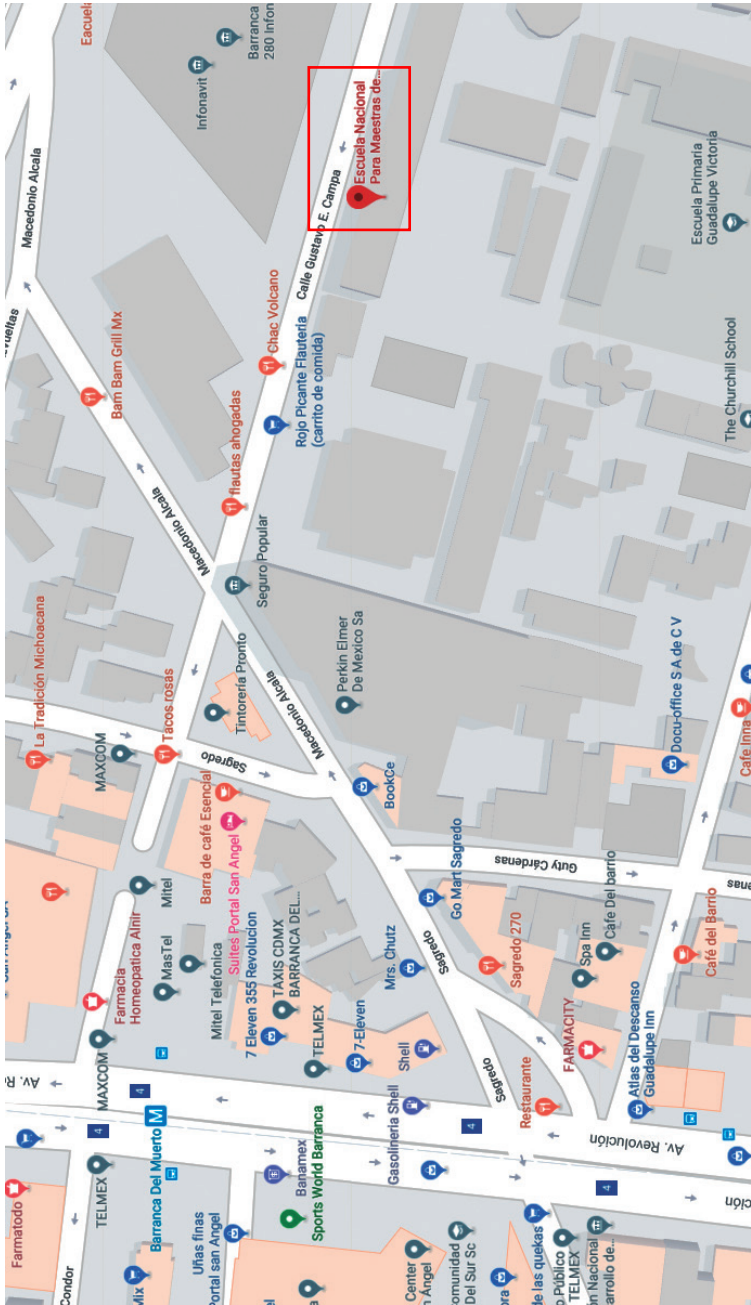
ENMJN | Gustavo E. Campa N° 94, Guadalupe Inn, Álvaro Obregón, Ciudad de México, 01020.