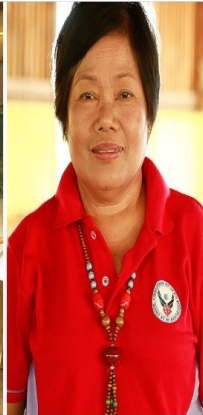
Poner fin a la violencia contra las mujeres