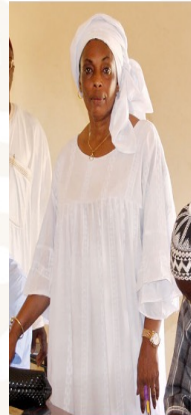
Liderazgo y participación política