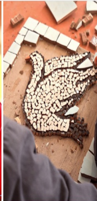
Las mujeres, la paz y la seguridad