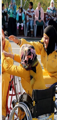
Mujeres y niñas con discapacidad