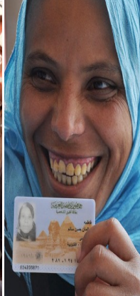
Gobernanza y planificación